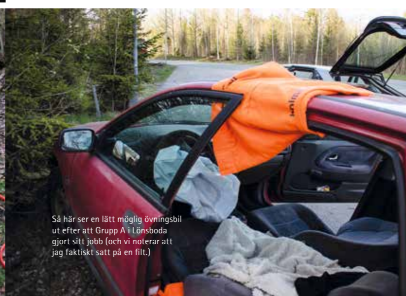
Så här ser en lätt möjlig övningsbil ut efter att Grupp A i Lönsboda gjort sitt jobb (och vi noterar att jag faktiskt satt på en filt.)

bilen, från att de börjar och tills han är ute på asfalten så har det bara gått 4,5 minut.