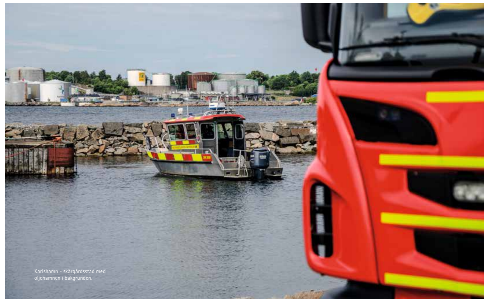
Karlshamn - skärgårdsstad med oljehamnen i bakgrunden.