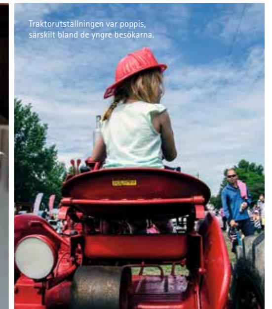
Traktorutställningen var poppis, särskilt bland de yngre besökarna.