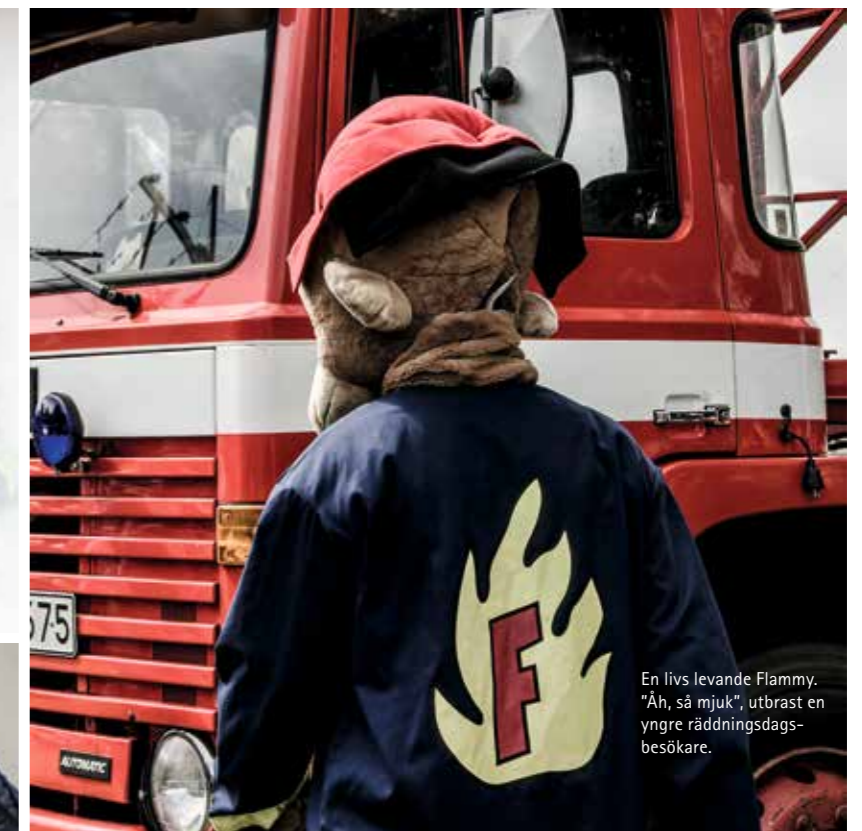
En livs levande Flammy. "Åh, så mjuk", utbrast en yngre räddningsdagsbesökare.