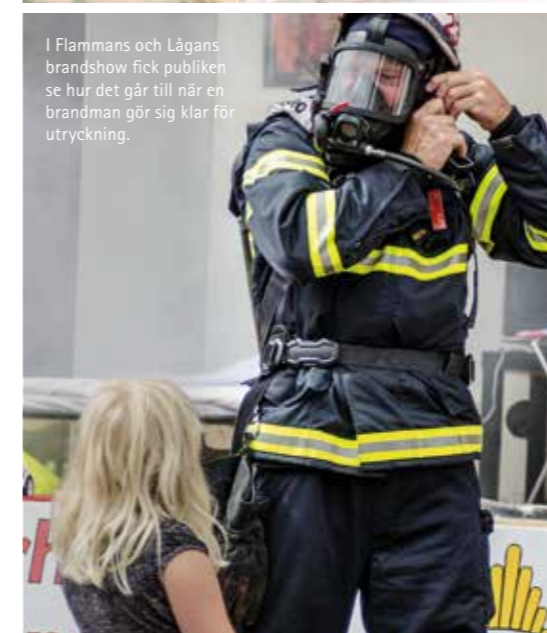
I Flammans och Lågans brandshow fick publiken se hur det går till när en brandman gör sig klar för utryckning.