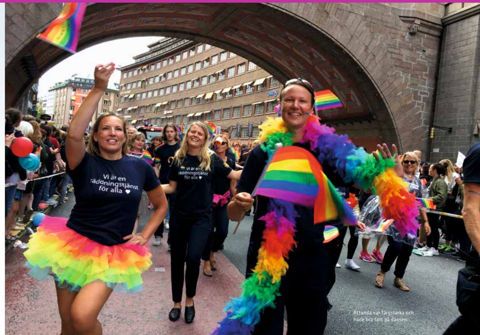
Attunda var färgstarka och hade bra fart på dansen.