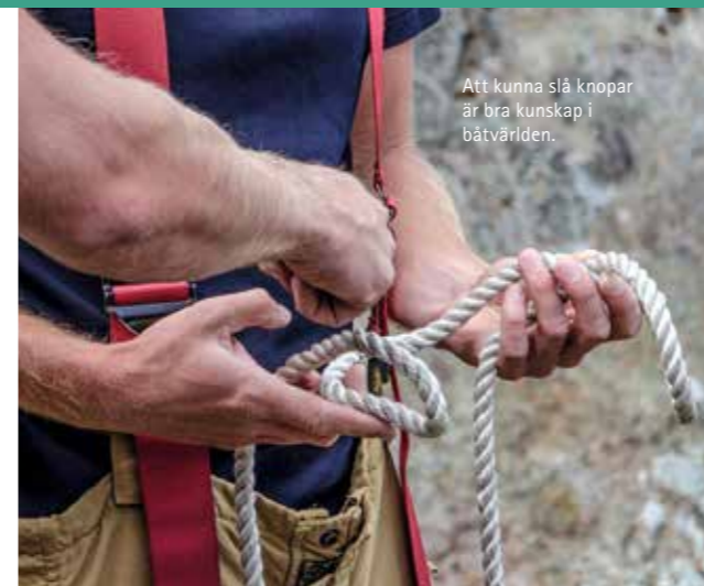
Att kunna slå knopar är bra kunskap i båtvärlden.

En snabb genomgång av regelverket (ytterst minimalt) och sedan kör vi igång. Den första minuten eller så är det snälla tag från motspelarnas sida men de glömmer sedan att jag är en gäst som man ska ta väl hand om.