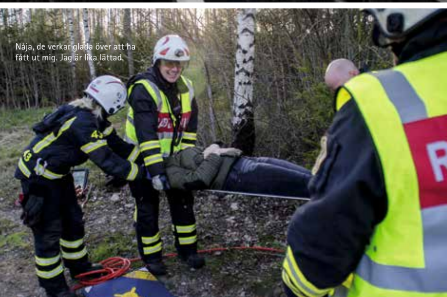
Nåja, de verkar glada över att ha fått ut mig. Jag är lika lättad.