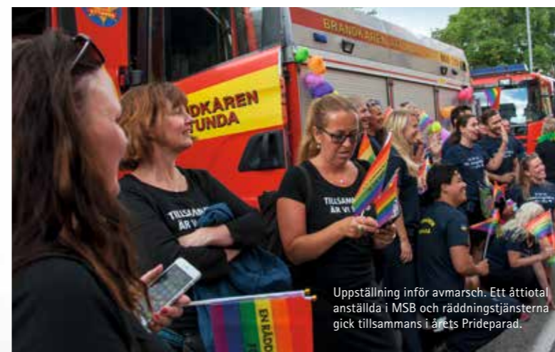
Uppställning inför avmarsch. Ett åttiotal anställda i MSB och räddningstjänsterna gick tillsammans i årets Prideparad.