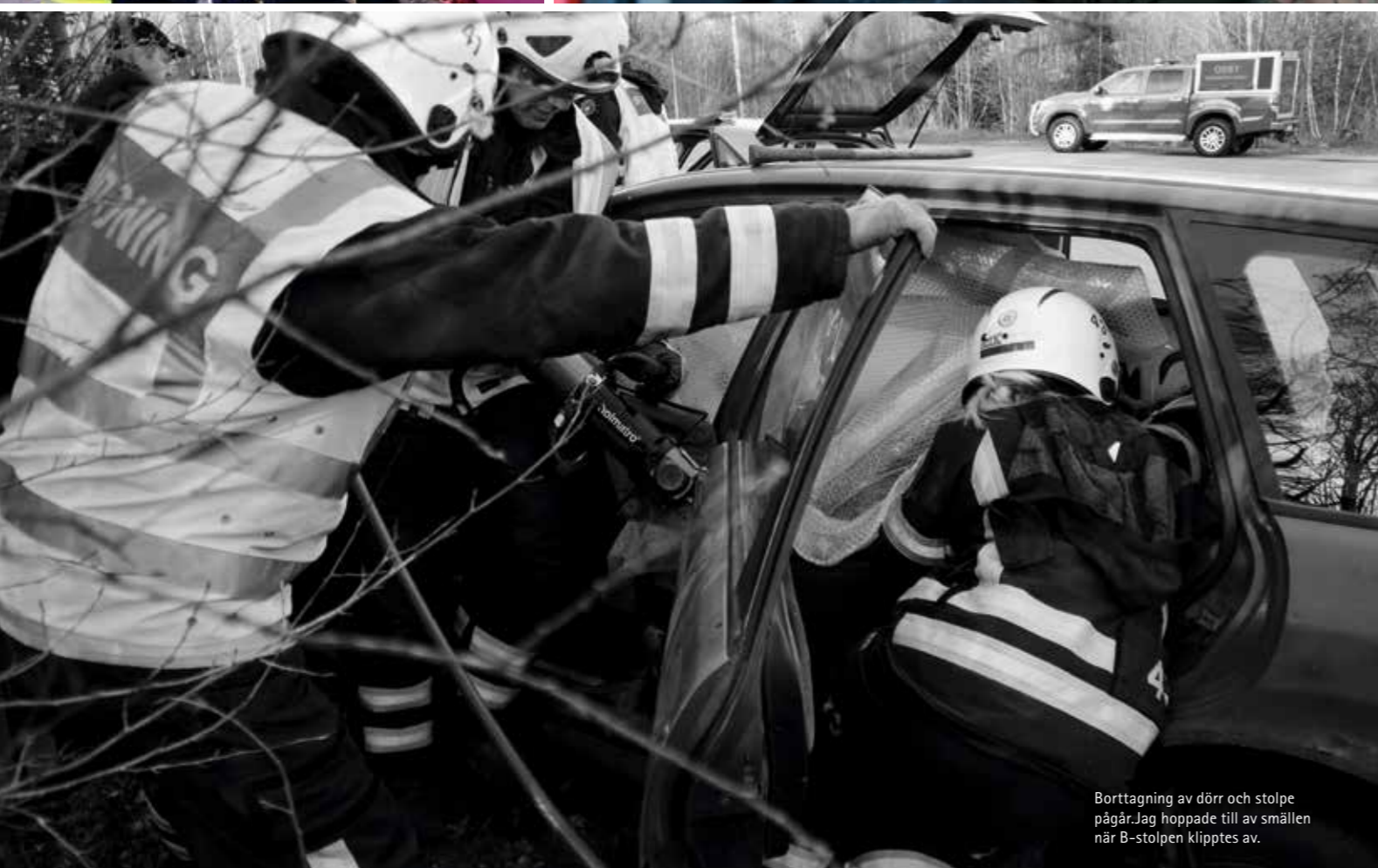
Borttagning av dörr och stolpe pågår. Jag hoppade till av smällarna när B-stolpen klipptes av.