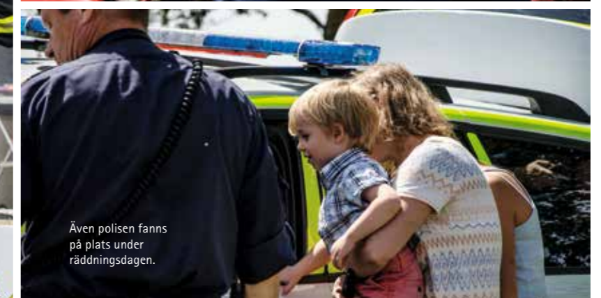
Även polisen fanns på plats under räddningsdagen.