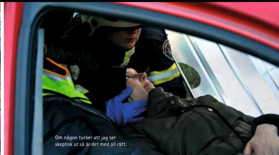
Om någon tycker att jag ser skeptisk ut så är det med all rätt.