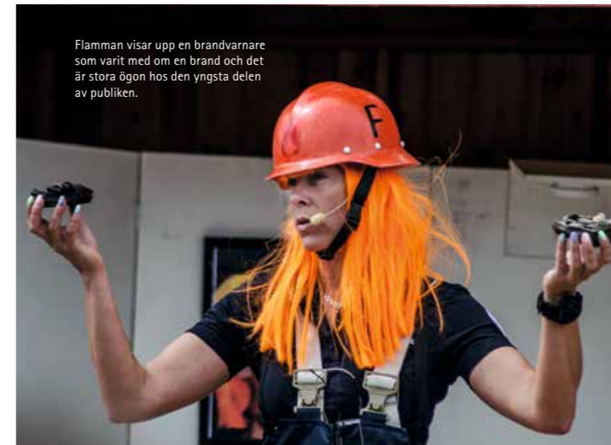
Flamman visar upp en brandvarnare som varit med om en brand och det är stora ögon hos den yngsta delen av publiken.