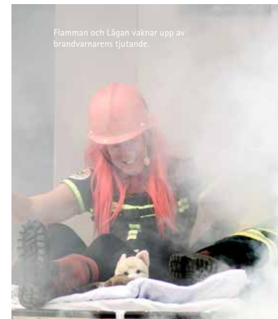
Flamman och Lågan vaknar upp av brandvarnarens tjutande.