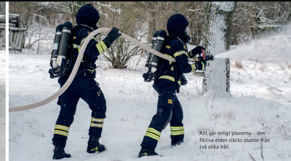
Allt går enligt planerna - den fiktiva elden släcks snabbt från två olika håll.