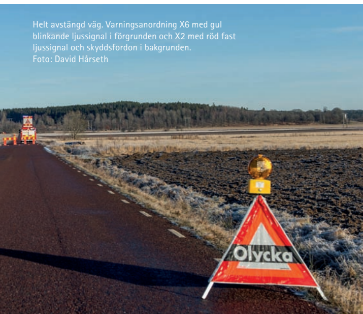
Helt avstängd väg. Varningsanordning X6 med gul blinkande ljussignal i förgrunden och X2 med röd fast ljussignal och skyddsfordon i bakgrunden.