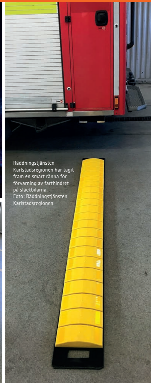
Räddningstjänsten Karlstadsregionen har tagit fram en smart ränna för förvarning av farthindret på släckbilarna.