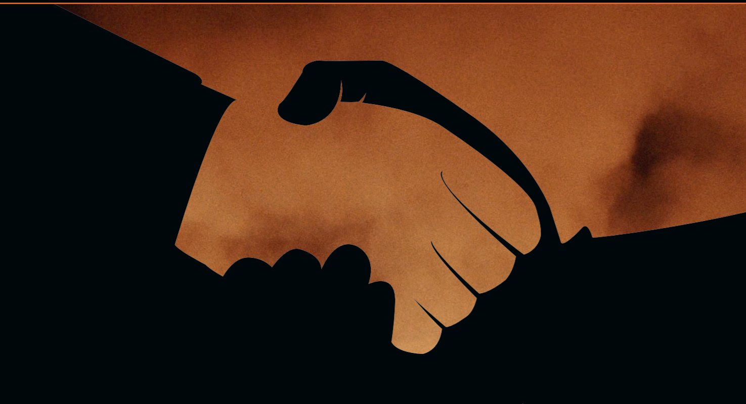
ILLUSTRATION: IRMER MEDIA / VECTOR OPEN STOCK, FOTO: PATRICK PERSSON