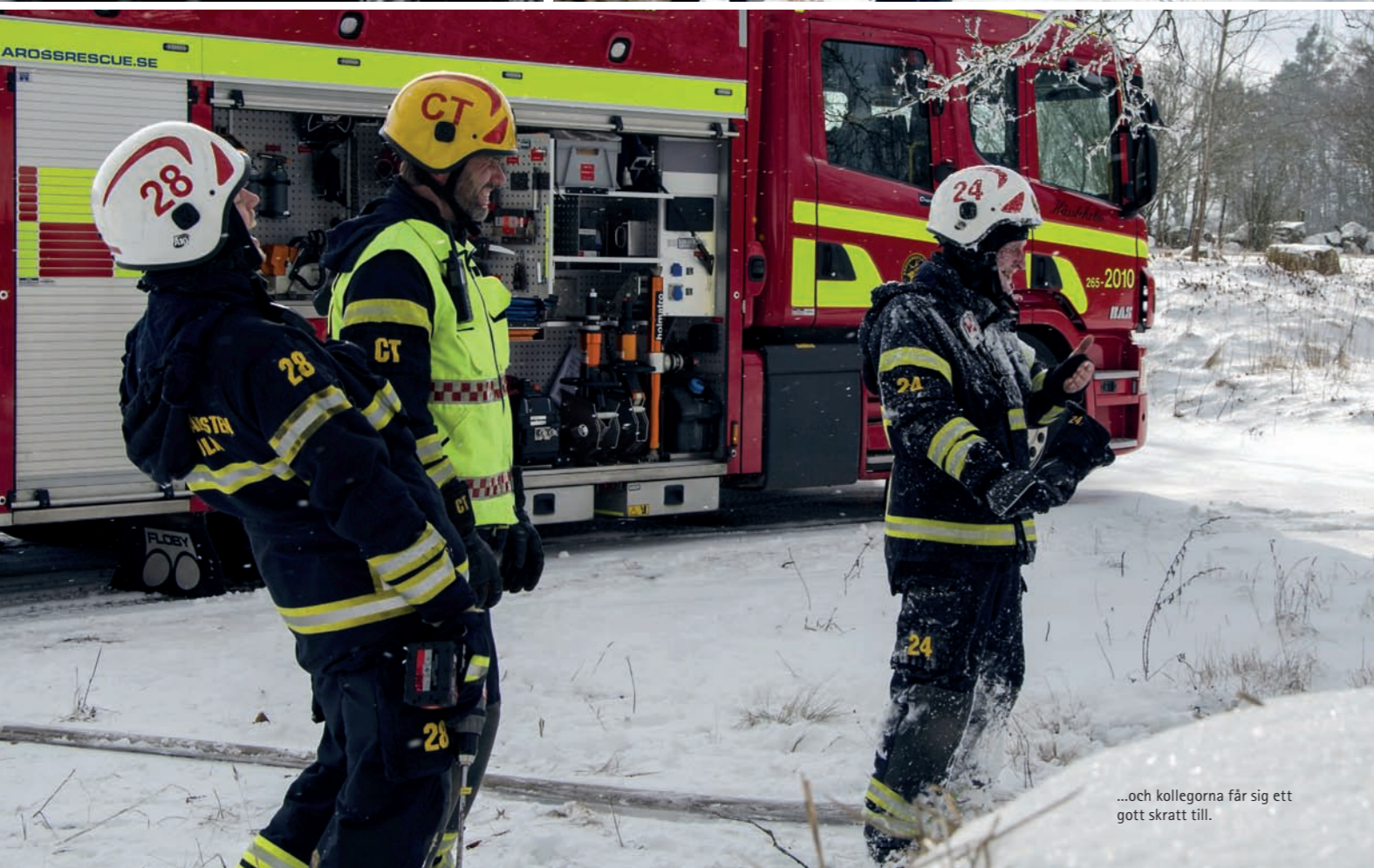
...och kollegorna får sig ett gott skratt till.