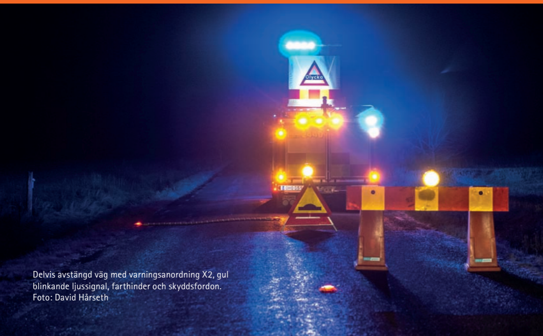
Delvis avstängd väg med varningsanordning X2, gul blinkande ljussignal, farthinder och skyddsfordon.