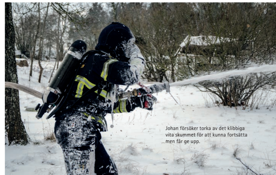
Johan försöker torka av det kläbbiga vita skummet för att kunna fortsätta - men får ge upp.